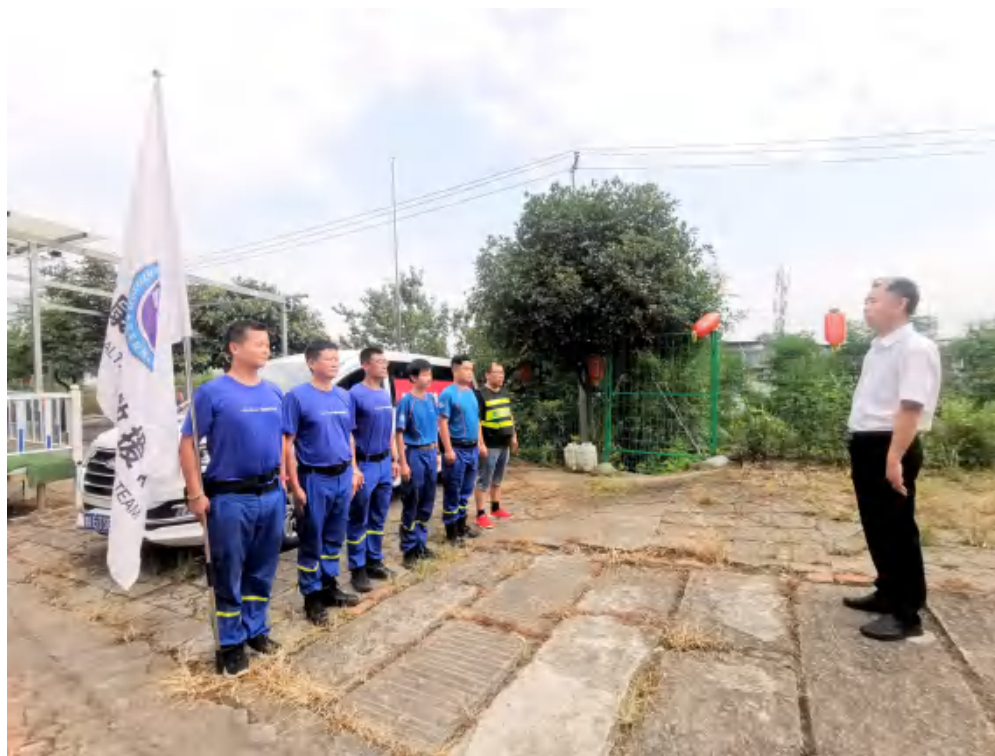
出发时市局领导做重要指示。