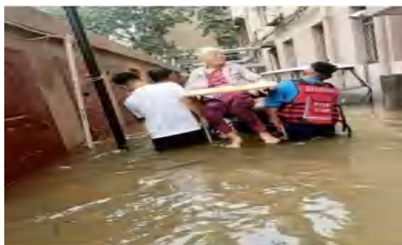
到其家中将行动不便的 80 多岁的奶奶转移到安全地带