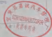
宜黄县蓝豹救援队支援河南水灾救援误餐费签字表

价税合计(大写): 伍仟零贰拾柒元零角 (小写): ¥5027.00 纳税人识别号: 92361026MA36T72P2R 地址: 电话: 蓝州宜黄县蓝豹救援队(蓝林总队内) 1382296604 开户行及账号: 中国建设银行蓝州支行蓝豹队支行43090170101973